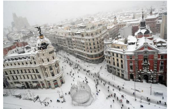
LA GRAN VIA, MADRID

La tormenta del siglo deja una nevada histórica en media España