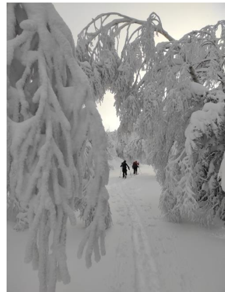
OS ANCARES, OURENSE